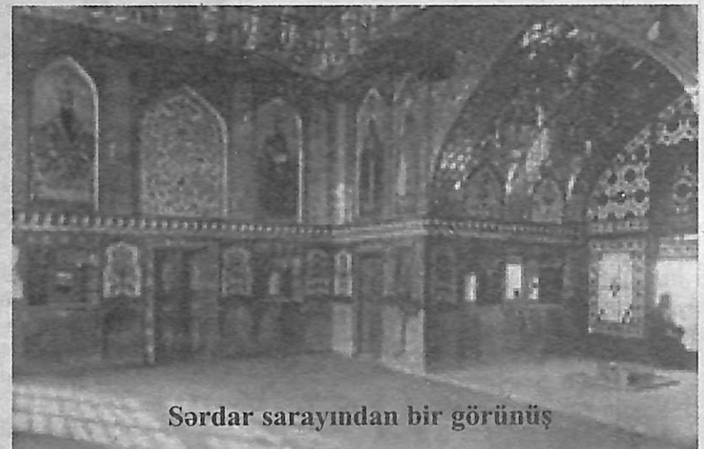
Sərdar sarayından bir görünüş

üç məscid saydım - Hacı Nəsrulla bəy məscidi və Şer Cami şəhər məscidi formasına görə tamamilə bir-birinin eynidir. Onların qapılarının çöl tərəfində türk dilində inşa tarixini göstərən yazılar var. Biz belə başa düşdük ki, məscid hicri tarixi ilə 1098-ci ildə tikilib. Həyətdə gül-çiçəklər əkilib... İnsan burada dincəlmək üçün bundan artıq heç nə arzulamazdı.