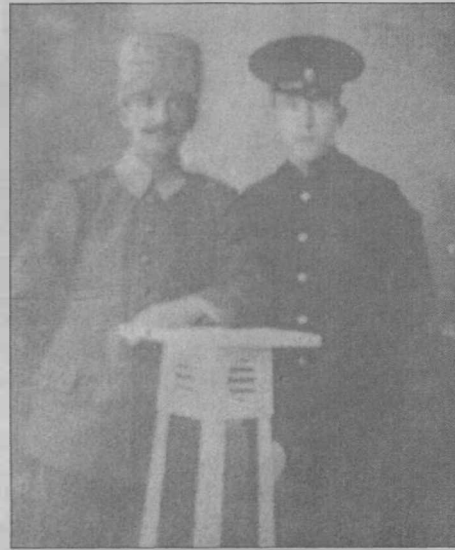
Sibir sürgünündə. Tomsk, 1915-ci il

Yüksək rütbəli bir zabit kimi, həm də bəlkə Türk Ordusu komandanı Ənvər paşaya çox oxşaması səbəbilə, onu Rus Qafqaz Cəbhəsi komandanı general Yudenin buradakı qərargahına gətirirlər.