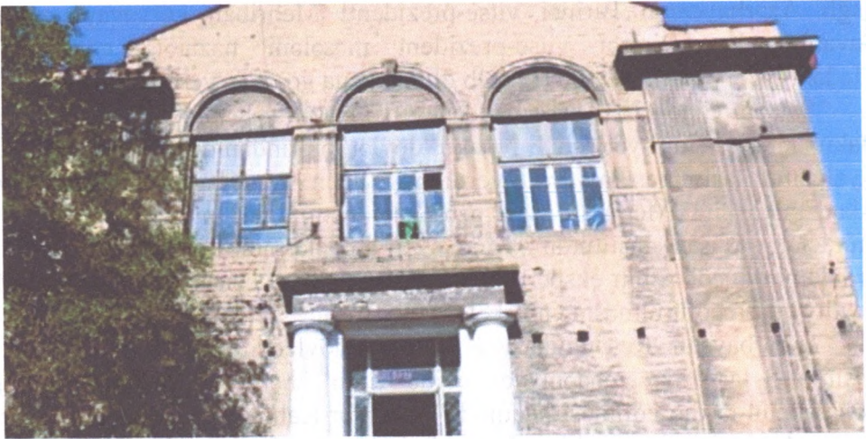
Şəkil 1. Molokanların mərkəzi.

Sovetlər dövründə din qadağan olunduqdan sonra, binanın funksiyası dəyişdirilir. Molokan mərkəzi Radio yayım binası kimi istifadə olunmağa başlayır. II dünya müharibəsi illərində radio yayım mərkəzindən xəbərlər yayımlanırdı. Artıq buradan dini yox, cəmiyyətin sosial-siyasi məsələlərinin sədasi gəlirdi. Sonralar tele-radio qülləsi istifadəyə verildikdən sonra, bina boşaldılmış, son illərdə isə gənclər tərəfindən kino- klub kimi istifadə olunmuşdur.