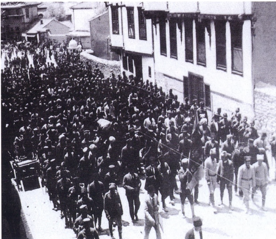
Nazim bəyin dəfni

Osmanlı dövləti Mudros müqaviləsinə (30 oktyabr 1918) imzaladıqdan sonra Qafqaz İslam Ordusu və onun komandanları Qafqazı tərk etməli olub. Nazim bəy bu dəfə Mustafa Kamal paşanın başlatdığı milli mücadiləyə qoşulmaq məqsədilə Anadoluya gedib. O, Anadoluda yunanlara qarşı mücadilə aparıb, xilafət tərəfdarlarının qaldıracağı üsyanların yatırılmasında rəşadət göstərib. I və II İnönü savaşılarında iştirak edən Nazim bəy 15 iyul 1921-ci ildə yunanlarla döyüşdə şəhid olub.