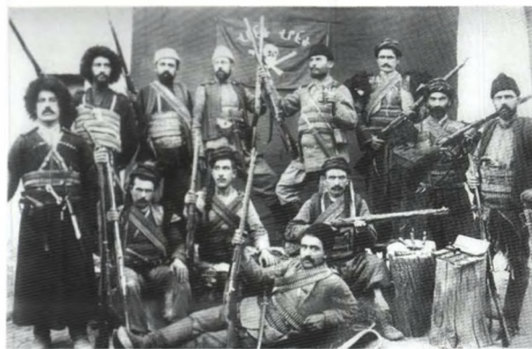
Один из армянских террористических отрядов. 1915 год

на окраинах империи. Армянские националисты не замедлили воспользоваться благоприятствующей их планам ситуацией. Активно вооружаясь при поддержке своих высокопоставленных соплеменников и сторонников в администрации наместника, они стали устраивать кровавые погромы и этнические чистки мирного мусульманского населения. Тем самым предполагалось расчистить «жизненное пространство» для армян - переселенцев из Малой Азии, которые должны были стать этническим фундаментом будущего армянского государства. Согласно программе партии «Гнчак», такое государство должно было охватить Южный Кавказ, восточную часть Малой Азии и часть северо-западного Ирана (5).