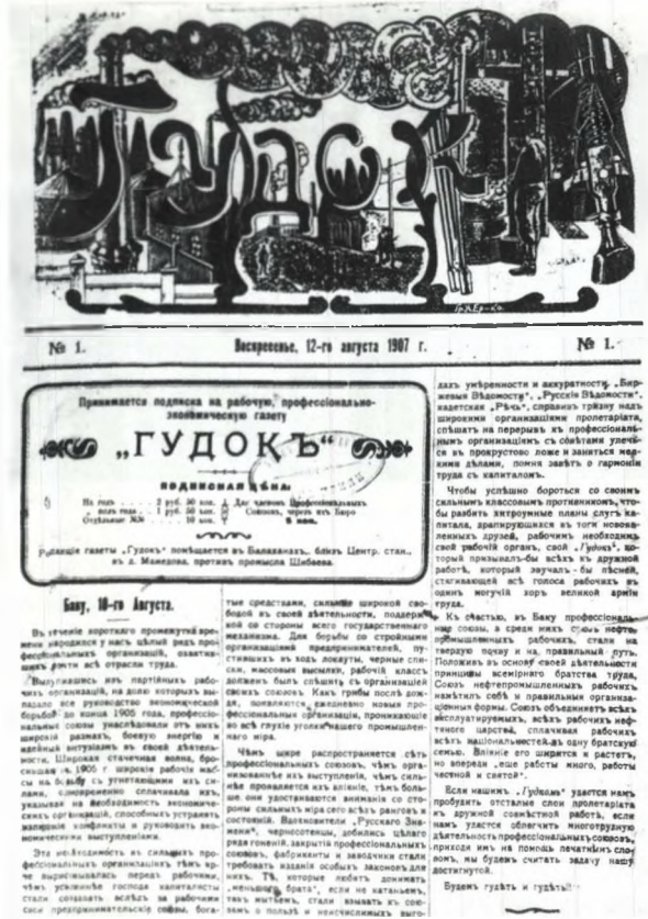
Номер газеты "Гудок" со статьёй об армяно-азербайджанских столкновениях в Баку

Тем временем азербайджанцы стали принимать меры самозащиты, также начали поджигать дома противной стороны. 17 августа азербайджанцы