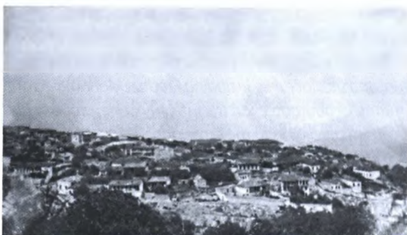
Шуша. Фотография начала XX века

Август 1905 года ознаменовал новую веху в истории армяно-азербайджанского конфликта 1905-1906 гг., положив начало ещё более кровопролитным столкновениям, охватывавшим всё новые города и уезды Южного Кавказа. Во второй половине августа в Шушинском уезде Елизаветпольской губернии вспыхнула армяно-азербайджанская резня. То, что она началась именно здесь, было не случайным. В начале XX в. Шуша превратилась в один из главных центров армянского национал-экстремизма. Как писал в 1903 г. елизаветпольский губернатор, именно в Шуше «пропаганда армянских революционеров свила себе настолько прочное гнездо, что борьба с преступной деятельностью их приобретает значение всё более и более серьёзной задачи правительства» [11, л. 6 об.]. В жандармских донесениях за 1904-й год Шуша упоминается не иначе как «место пребывания главного центрального комитета армян» [4, л. 28].