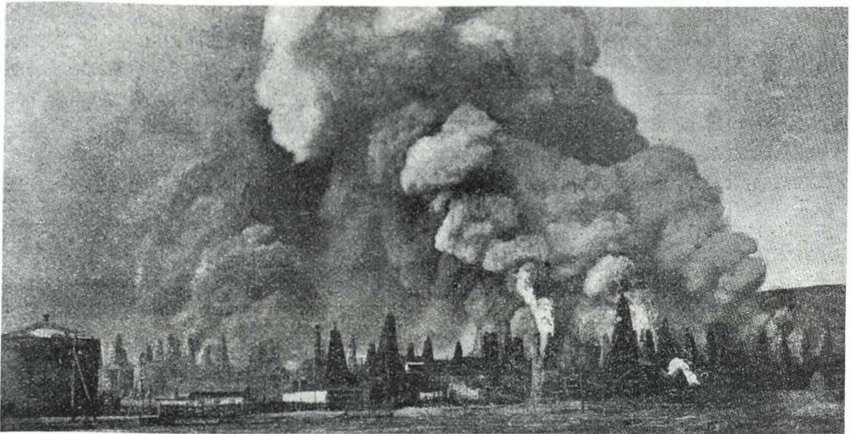
Газетная фотография бакинских нефтепромыслов, подожженных во время армяно-азербайджанской резни 1905-1906 годов