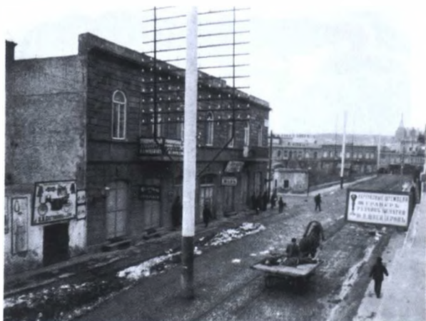
Уборка трупов на улицах Баку после армяно-азербайджанской резни