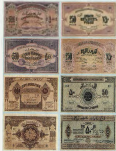
Купюры денежной единицы АДР – маната разного номинала. Национальный музей истории Азербайджана

сказать, что современный сильный Азербайджан - достойный преемник АДР. ●