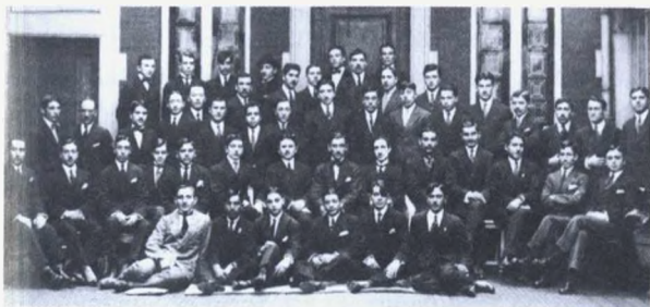
Группа азербайджанских студентов, отправляющихся на учебу в Европу за государственный счет. 1920 год

марта страны. Однако уже с самого начала азербайджанское государство столкнулось с необоснованными претензиями на Карабах и ряд других земель со стороны Армянской Республики, которая была провозглашена одновременно с АДР. На переговорах с министром иностранных дел Османской империи в Стамбуле 18 ноября 1918 года председатель парламента Азербайджана Алимардан-бек Топчубашов сказал: «Карабахский вопрос, поднятый армянами, касается не 5 или 10 деревень, он охватывает все четыре уезда: Шушу, Джаваншир, Джебраил и Зангезур. Эта территория принадлежит только одной нации, и хотя количество мусульман и армян не равно, нет оснований говорить о господстве армян, потому что они не являются коренными жителями этих мест. Это те, кто переехал в наш регион из Турции после войны с Россией... Наконец, армяне не живут в самом Карабахе отдельно, они образуют смешанные поселения с азербайджанцами. Тем не менее, мы выступаем за мирное урегулирование проблемы».