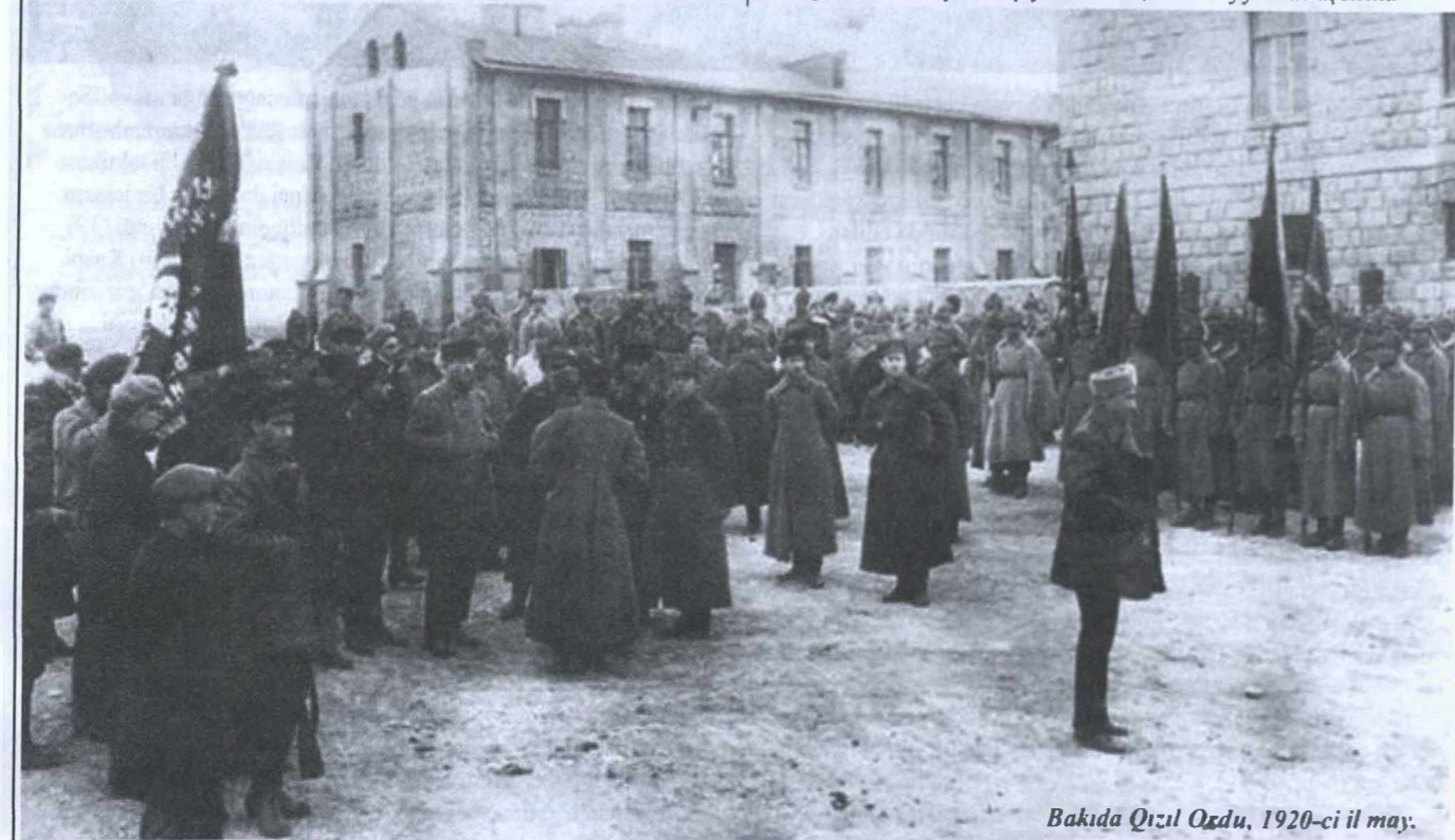
Bakıda Qızıl Oqdu, 1920-ci il may.

1917-ci il Fevral Burjua Demokrat İnqilabı baş verdikdən sonra hakimiyyətdə olan istər Kadetlər istərsə də eser-mənşevik bloku, müsəlman milli hərəkatına qarşı düşmən mövqedə dayanırdılar. Onların "Vahid və bölünməz Rusya" şüarları da Azərbaycan siyasi xadimlərinin istəklərinə uyğun gəlmirdi.(25,s,123) Kaspi qəzetinin 1 avqust tarixli sayında qeyd edilir ki, hakimiyyət ruslaşdırma