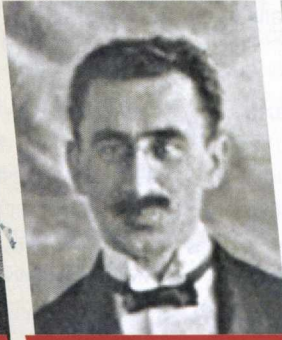
MUSA BƏY RƏFİYEV - PORTFELSİZ NAZİR; MƏZAHİB VƏ MÜAVİNƏ ((MƏZHƏBLƏR VƏ SOSIAL TƏMİNAT) NAZİRİ; SƏHIYYƏ NAZİRİ