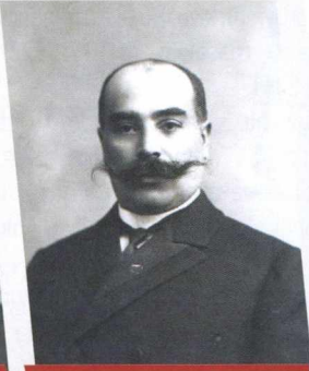
İSMAYIL XAN ZİYADXANOV - HƏRBİ İŞLƏR MÜVƏKKİLİ