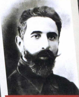
ASLAN BƏY SƏFİKÜRDİLİ - POÇT VƏ TELEQRAF NAZİRİ; ƏDLİYYƏ VƏ ƏMƏK NAZİRİ