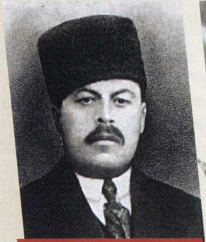
XUDADAD BƏY RƏFİBƏYLİ - SƏHIYYƏ NAZİRİ; ÜMURİ-NAFİƏ VƏ KEYRİYYƏ (SOSIAL TƏMİNAT) NAZİRİ