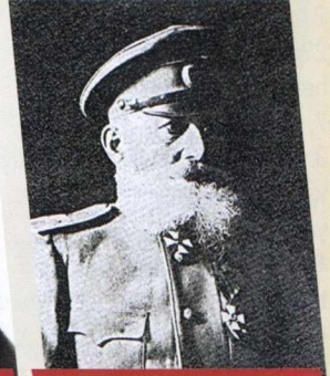
SƏMƏD AĞA MEHMANDAROV - HƏRBİYYƏ NAZİRİ