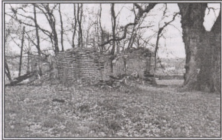
Subaba türbəsi XVI əsr

İstər-istəməz ortaya belə bir sual çıxır: "Axı Azərbaycanda heç vaxt yunanlar yaşamayıb. Yaşamadıqları yerə onlar necə ad verə bilirdilər?" Təbii ki, o vaxt bu suala cavab tapmaq bir məktəbli üçün mümkün deyildi. İnstitut illəri başladı. İxtisasım olmasa da çox həvəsli olduğum üçün əlimə düşən tarix kitablarını, jurnal və qəzetlərdə çıxan məqalələri oxuyurdum. İnstitutda bəzi vətənpərvər müəllimlərin sayəsində də müəyyən mətləbləri anlamağa başladım. Anladım ki, sovetlər dövründə Şimali Azərbaycanın tarixi total şəkildə təhrif edilmiş və yalan faktlarla