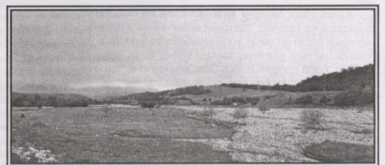
Alpan kəndi,Alpançay(Quru çay),Şahdağ

lalarını davam etdirdilər, Qafqaz Alban dövlətindən 6 əsr sonra Orta Asiya Alban dövlətini qurdular. (mənbə: Əkbər N.Nəcəf, "Hun milliyyəti", Bakı, 2015) Bu da Alban adlanan "alpanlar"ın