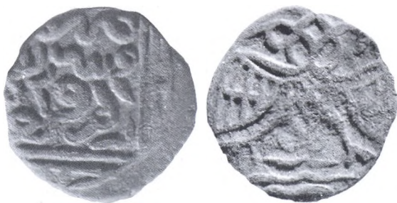
Рис. 2. Анонимная: Крым (?). 1340-е годы (?). Стилизованное изображение орла.

ски, в т.ч. именная монета Токтамышша, пул Хаджи-Тархана (?). Время чеканки монет некоторых типов неясно. Возможно, дальнейшее накопление информации позволит продвинуться в этом вопросе. Так, например, монеты с изображением льва среди звезд и легендой «пул Крыма» предположительно датируются серединой XIV – началом XV в. [Лебедев, 2000, № м53]. Но веских оснований для такой (или какой-либо другой) датировки пока не представлено.