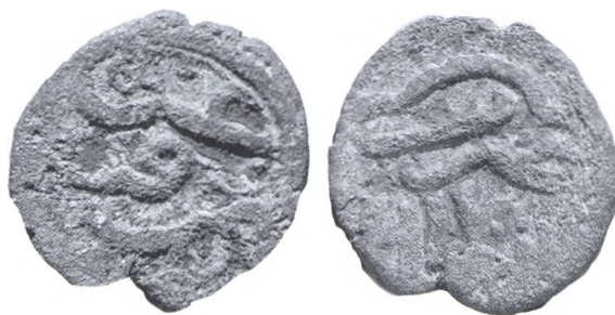
Рис. 3. Анонимная (?): Шехр ал-Джедид. 1360–1370-е гг. Моноэпиграфная.

Пулы ал-Джедида со сложным орнаментом, четырьмя «узлами счастья» и искаженной датой в виде «872» г.х. уже фиксировались в Азове, на Маджарском и Селитренном городищах (по 1 экз.) [Фомичев, 1981, с. 234, № 150; Павленко, Лебедев, 2005, с. 35, № м17; Клоков, Лебедев, 2002, с. 108, № 91/4]. Под датой имеется неясная надпись. По наблюдениям В.П. Лебедева, «чаще этот пул встречается в Крыму, поэтому, возможно, следует согласиться с прочтением неясного слова под датой как “Крым”» [Павленко, Лебедев, 2005, с. 35]. Время чеканки таких монет также не до конца ясно. В.П. Лебедев отмечает, что истинная дата может быть как 782, так и 772 г.х. (1380–1381 или 1370–1371 гг.) [Там же]. На наш взгляд, предпочтительнее первая, поскольку она более близка к дате на другом типе пулов ал-Джедида, схожем по оформлению, – 783 г.х. (1382–1383 гг.). Медные монеты ал-Джедида с несколько иным орнаментом и датой 783 г.х. (1382–1383 гг.) ранее также были встречены в Азове (1 экз.), на Селитренном (1 экз.) и Маджарском (3 экз.) городищах [Фомичев, 1981, с. 234, № 151;