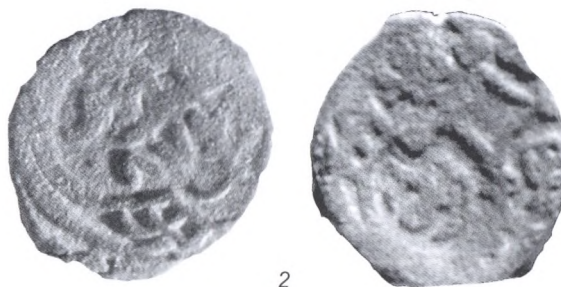
Рис. 4. Анонимные: Ал-Джедид. 1370–1380-е гг. Геометрический орнамент.

Клоков, Лебедев, 2002, с. 109, № 94/7; Павленко, Лебедев, 2005, с. 35, № м18].