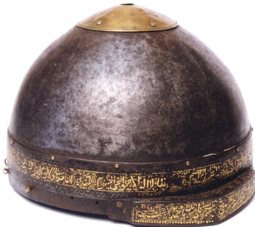
Рис. 1. Шлем из СКОИКМ (инв. № СКОМ оф. 455).

По материалу изготовления шлем относится к классу железных, по конструкции тульи – к отделу цельнокovaných, по форме купола – к типу полусферических