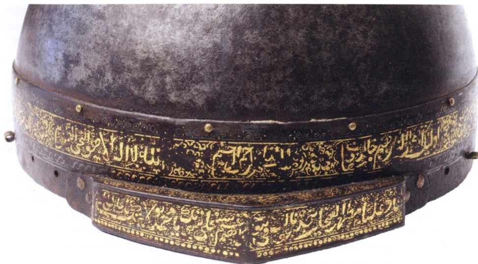
Рис. 2. Козырек и фрагмент обруча шлема из СКОИКМ.

(рис. 1). Его высота (без несохранившейся трубки-втулки для плюмажа) 23,5 см, диаметр 21,0 см. Характерным элементом конструкции шлема является низкая туля полусферической формы, выкованная из одного куска железа. Повреждения тульи незначительны, в основном это царапины и неглубокие вмятины. К ее нижней части приклепан широкий (4,5 см) железный обруч с ровными краями. Заклепки с медными или позолоченными шляпками вбиты вдоль его верхнего края. Центральная часть обруча украшена орнаментом, выполненным в технике золотой насечки по металлу. Узор представляет собой ряд подпрямоугольных горизонтальных «картушей», в которые помещены надписи на арабском языке и изображения миниатюрных двулепестных стеблей. Боковые стороны «картушей» оформлены полукруглыми фестонами с двойным золотым кантом, фон покрыт золотым точечным орнаментом, а пространство между ними заполнено изображениями распустившегося пятилепесткового цветка в обрамлении вьющихся растительных побегов. Основной рисунок на обруче шлема окаймлен сверху цепью несомкнутых колец, окруженных золотыми «искрами», снизу – гирляндой из S-образных завитков. Если надписи на обруче сохранились достаточно хорошо, то окантовочный орнамент затерт, а позолота в значительной степени утрачена (рис. 1).