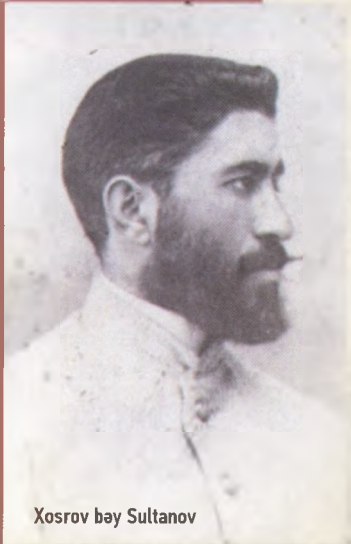
Xosrov bəy Sultanov

Azərbaycanın ilk Hərbi naziri, Qarabağın cəsur müdafiəçisi