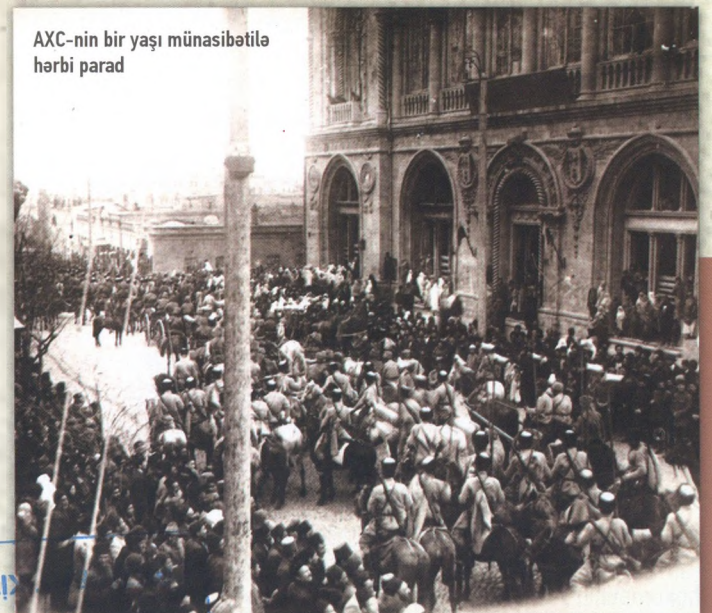
AXC-nin bir yaşı münasibətilə hərbi parad

Müsavət Partiyasını tərk etmiş müəyyən sayda insanlardan 1924-cü ilin payızında İstanbulda X.Sultanovun rəhbərliyi altında bir qrupun təsisatı barədə məlumatlar var. Mühacirlərin Mərkəzi orqanı olan İstiqlal Komitəsini tanımaq istəməyən bu qrup Azərbaycan Milli Demokratik Respublika Partiyasını yaratdıqlarını elan etmişdilər. X.Sultanovun qardaşı İskəndər bəy Sultanovun Azərbaycan-İran sərhədində üsyançı dəstəyə başçılıq etməsi və tez-tez Qarabağa hücum edib sovet hökumətinə problemlər yaratması mühacir dairələrdə X.Sultanovun mövqeyini möhkəmləndirirdi.