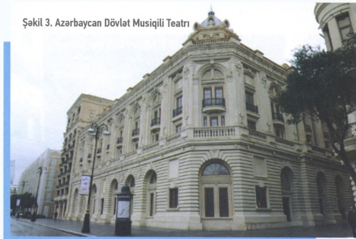
Şəkil 3. Azərbaycan Dövlət Musiqili Teatrı

1909-cu ildə Dənizkənarı bulvarda mühəndis İ.Ploşkonun layihəsi əsasında "Fenomen" kinoteatrı tikilməli idi. Ancaq şəhər bələdiyyəsi buna razılıq vermir. Səbəb kimi tikiləcək binanın bulvarda camaatın gəzintisinə mane olacağı, ansamblın pozulacağını söyləyirlər. Və