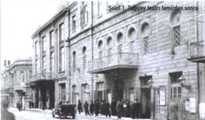
Şəkil 1. Tağıyev teatrı təmirdən sonra