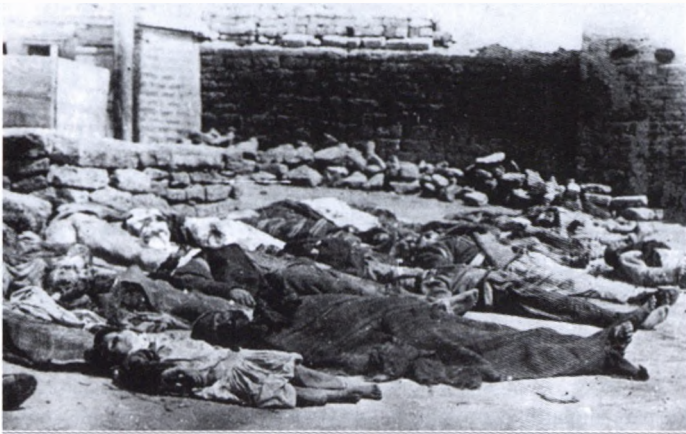
Bakıda 1918-ci il mart soyqırımının qurbanları

başlıca maneə rolunu oynayır. Əməllərinə görə heç vaxt məsuliyyət daşımamış Ermənistan cinayətlərini davam etdirir. Nə vaxtsa ondan bu cinayətlərinin hesabının soruşulmayacağına arxayındır. Buna görə də münaqişənin həlli prosesində qeyri-konstruktiv mövqə tutaraq, həmişə olduğu kimi, bu qayda ilə istəklərinə nail olacağına ümid edir. Buna görə də Azərbaycanın ermənilər tərəfində tarix boyu zəbt etdiyi ərazilərin gündəmə gətirilməsini böyük qorxu və həyəcanla qarşılayır, bu faktdan Azərbaycana yeni böhtanlar atmaq üçün istifadə edir. Onlar İrəvanın, Zəngəzurun, Göyçə mahalının və digər ərazilərin Azərbaycanın tarixi torpaqları olduğunu gözəl bilir və dərk edirlər. Bu gün həmin faktların dövlət səviyyəsində qaldırılmasını özləri üçün təhlükə kimi qəbul edirlər. Çünki bunun həqiqət olduğunu bilirlər. Həmin torpaqlarda ədalətin öz yerini tutması zamanın məsələsidir.