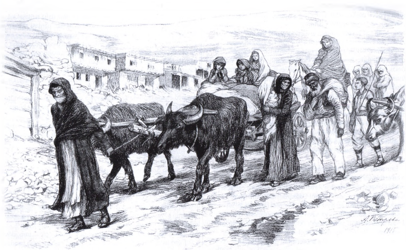
Ermənilərin Türkiyədən Cənubi Qafqaza köç etməsi (Рис. худ. А. Петрова, собств. «Литфонд») Армянские бегенцы.

XIX-XX əsrlərdə Şimali Azərbaycan torpaqlarının tutulması və oraya yad millətlərin, xüsusən ermənilərin köçürülməsi tarixinin araşdırılması böyük aktualıq kəsb edir. Azərbaycanın müstəqilliyini bərpa etməsindən sonra onun öz tarixinə, mədəniyyətinə, torpaqlarına sahib çıxması, itirilmiş ərazilərin qaytarılması məsələsinin qaldırılması qanunauyğun bir prosesdir. Bu mənada Prezident İlham Əliyevin Yeni Azərbaycan Partiyasının VI Qurultayında Ermənistan tərəfindən son yüzilliklər dövründə zəbt edilmiş torpaqlarının Azərbaycan xalqına məxsus olması faktını qeyd etməsi və Azərbaycan xalqının əvvəl-axır öz torpaqlarına qayıtmaq iradəsini ifadə etməsi fərqli reaksiyalara səbəb olmuşdur. (1) Ermənilər isə həmin faktdan hay-küs salmaq, Azərbaycanı günahlandırmaq istiqamətində qarayaxma kampaniyasına başlayıblar. Onların bu