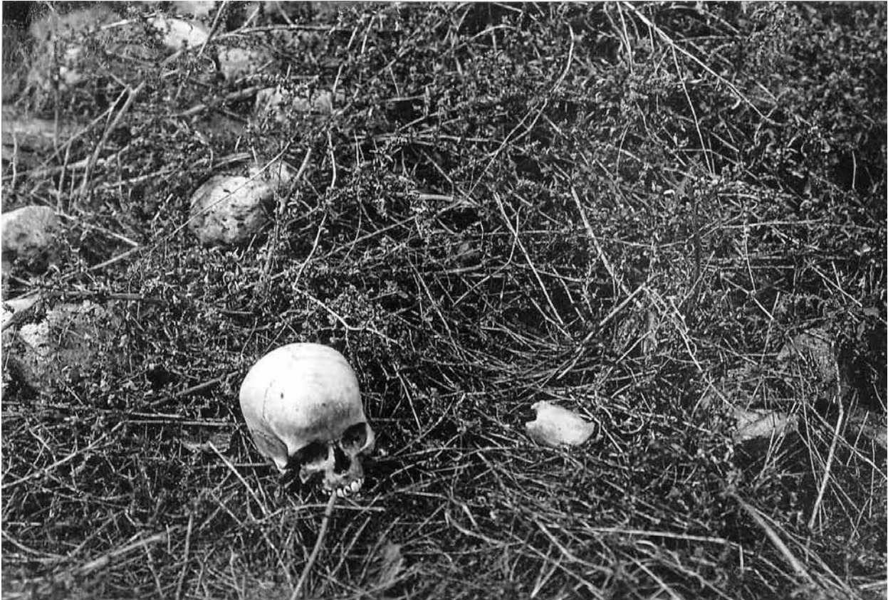
Человеческие останки во дворе дома Султановых на Шихминасской улице Шамахи.