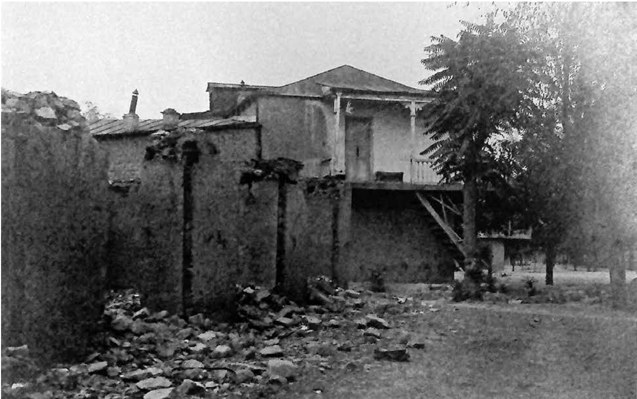
Разрушенный дом азербайджанца и невредимый дом армянина в Кюрдамире.

На фотографиях, сделанных в элитном районе города Пиран-Ширван , заметно, что все деревянные части домов сгорели, а часть белокаменных стен почернела от пожаров и осыпается. Все свидетельствует о том, что строения были подожжены преднамеренно с помощью зажигательных смесей.