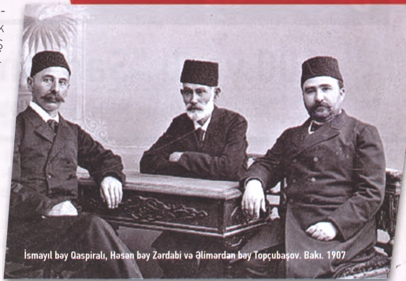
İsmayıl bəy Qaspiralı, Həsən bəy Zərdabi və Əlimərdan bəy Topçubaşov. Bakı. 1907

“ Azərbaycanın istiqlaliyyətinin tanınmasından sonra Versaldakı nümayəndə heyətinin fəaliyyəti daha da genişləndi. Sülh konfransının rəsmən yanvarın 21-də başa çatmasına baxmayaraq Azərbaycan nümayəndə heyəti hələ bir müddət Avropada öz missiyasını yerinə yetirməkdə davam etdi. Azərbaycan nümayəndələri 1920-ci ilin fevral–mart aylarında keçirilmiş London və aprel ayında keçirilmiş San-Remo konfransına qatıldılar.