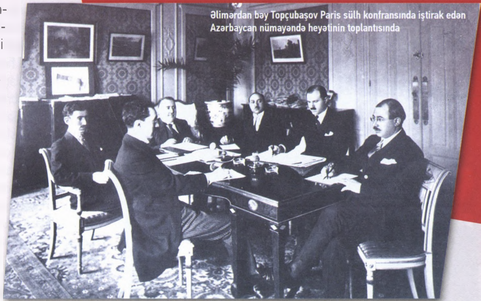
Əlimərdan bəy Topçubaşov Paris sülh konfransında iştirak edən Azərbaycan nümayəndə heyətinin toplantısında

Ə.Topçubaşov sədr-əzəm Tələt paşa ilə görüşündə türk əsgərlərinin Bakının azad edilməsində iştirakına görə hökumətin təşəkkürünü çatdırır, Azərbaycanda və ümumiyyətlə, müsəlmanlar arasında məzhəbçiliyin qızıqdırılmasının imperializmin ənənəvi siyasəti olduğunu göstərir və uzaqgörənliklə söyləyir ki, Rusiyadakı hökumət də həmin siyasəti yeridir və bolşeviklər müsəlmanlara düşmən münasibətlərini Bakıda törətdikləri hərəkətləri ilə təsdiqləyirlər. Əlimərdan bəy danışıqlar zamanı erməni xislətinə dərin bələdçiliyini də nümayiş etdirir. Bildirir ki, bu xoş məqsədə nail olmağın böyük çətinlikləri vardır. Əgər gürcülərlə sülh yolu ilə keçinmək mümkünə, ermənilərlə çox çətindir. Nə qədər ölkə varsa, onların o qədər oriyentasiyası vardır. İstanbula sizə öz məhəbbət və sədaqətlərini bəyan edirlər,